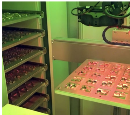
Different objects on each pallet Verschiedene Objekte auf jeder Palette