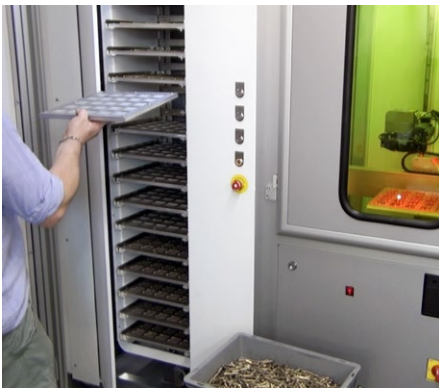
Loading/unloading during operation Be- und Entladens während des Betriebes

Integriertes Koaxial-Vision-System mit hoher Präzisionszentrierung und automatischer Erkennung der Stücke, Steuerungsschnittstelle, die die Markierung der Auftragsverwaltung für jede Palette ermöglicht (auch während des Betriebs).