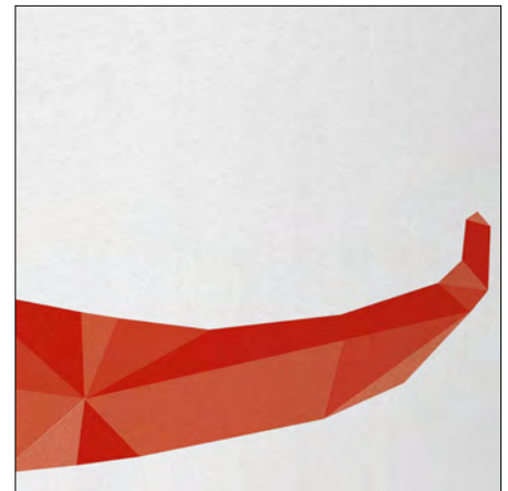
Endergebnis: Hochwertiger Tampondruck

Das INTAGLIO-Laserklischee – eine Entwicklung von TAMPOPRINT. Für Sie produziert, um beste Druckergebnisse zu erzielen. Mit der feinen Gravur im Klischee ist es perfekt für den detailreichen Tampondruck geeignet. Egal ob einfarbig, mehrfarbig oder für ein fotorealistisches CMYK-Druckmotiv.