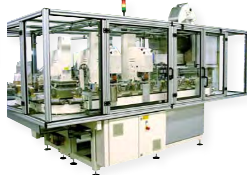
4-Farben-Automatation mit Zuführung