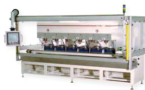
Linear-Automatation mit Highspeed-Servoachse