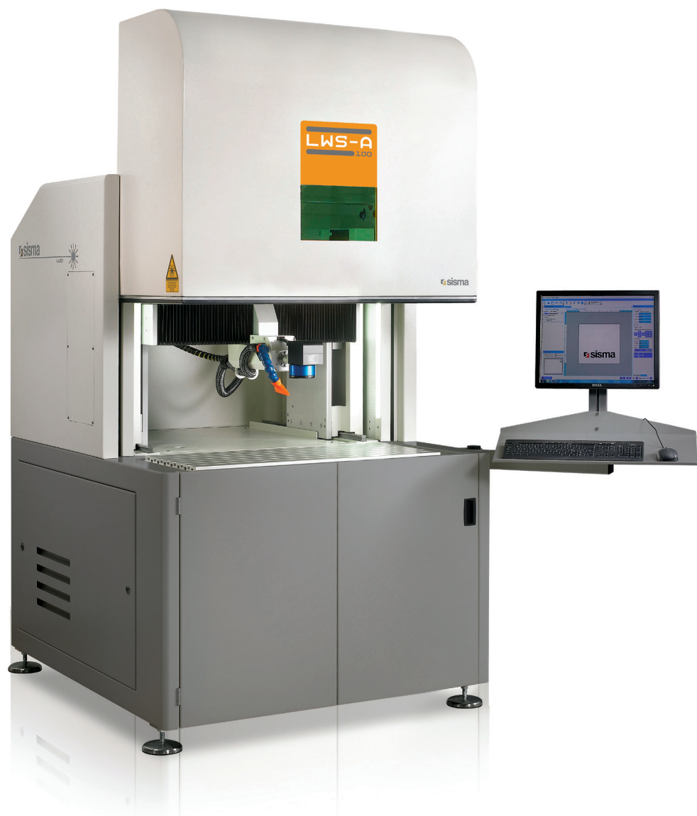
Laser marking stations with three axes Lasermarkiersystem mit 3 Achsen