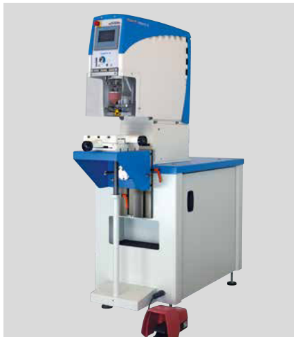
HERMETIC 60 mit Universal-Untergestell, Winkeltisch, Kreuzsupport und Fusstaster

Nach wie vor zeichnet sich die HERMETIC-Serie durch ihre bekannten Stärken aus: kurvengesteuerter elektromechanischer Antrieb, hohe Laufruhe, sehr gute Druckpositionsgenauigkeit und hohe Druckwiederholgenauigkeit. Hinzu kommen die verschiedensten Ausstattungsmöglichkeiten der Serie, welche die Realisierung unterschiedlichster Anwendungen ermöglichen.