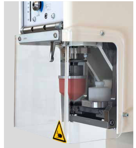
Optimierter Frontschutz mit besserem Einblick in den Druckprozess

Die optionale Restfarbenabholung bietet eine smarte kompakte Lösung während des Druckprozesses. Sie wird rückseitig in die Maschine