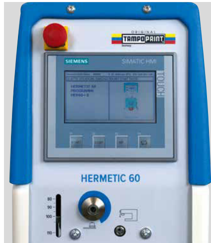
Moderne Bedienung über benutzerfreundliches Touchdisplay

Ein weiteres Highlight ist das elektronische Nockenschaltwerk für eine exakte Einstellung der Stopp- und Meldepunkte innerhalb des