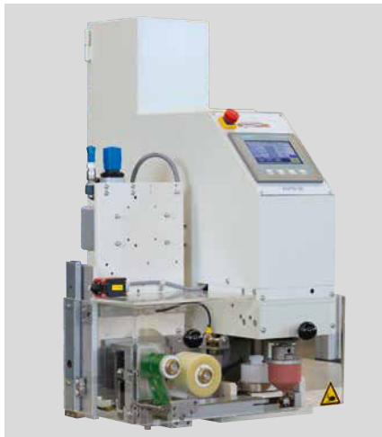
RAPID 60 Einbau mit Option Restfarbenabholung

Die RAPID-Serie wird als Einbaumaschine in vollautomatische Prozesse in verschiedenen Industriebereichen, wie z.B. Automobil, Spielzeug, Medizintechnik u.v.m., integriert. Ihr Fokus liegt hierbei auf Produktmarkierungen und -dekorationen, die in hoher Auflage und in hoher Prozess-Geschwindigkeit gefertigt werden.