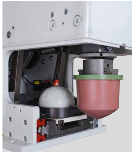
Druckbereich RAPID 90

Die Maschine besticht durch ihre hohe Geschwindigkeit und gleichzeitig durch die hohe Wiederholgenauigkeit. Sie überzeugt durch ihre