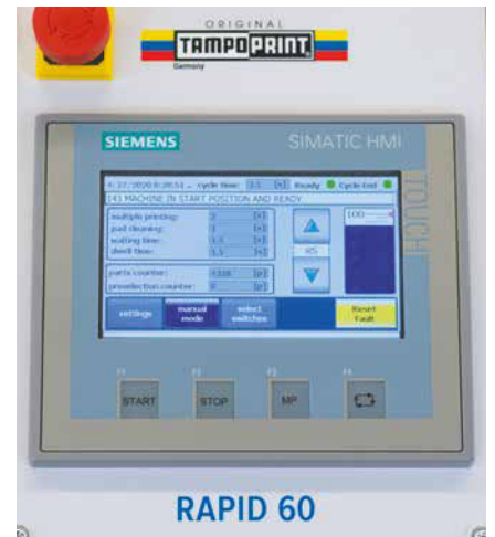
Moderne Bedienung über benutzerfreundliches Touchdisplay

Die RAPID-Baureihe ist mit nützlichen, praktischen und zusätzlichen Erweiterungen für