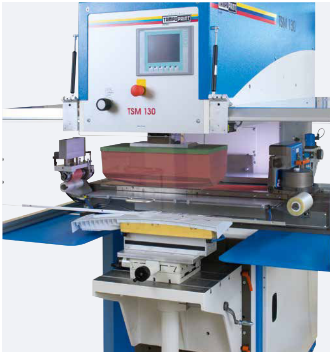
TSM 130 universal Querrakelkit mit Restfarbenabholung (Option)