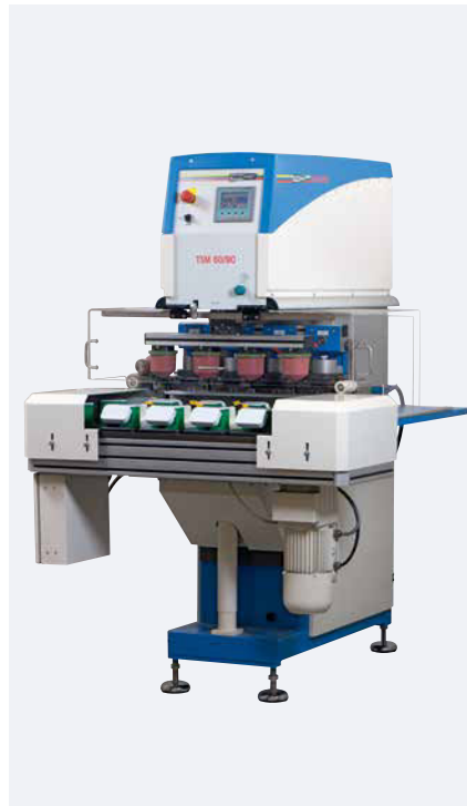
TSM 60/90 universal Mehrfarbenkit Solo