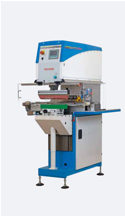
TSM 60/90 universal Querrakelkit

Ausführungen mit servomechanischem Antrieb zeichnen sich durch sehr hohe Taktzahl und sehr hohe Druckkraft aus. Energieeffizienz bei der Kinematik von Rakel- bzw. Tamponbewegung sowie ressourcenschonender Maschinengestellaufbau runden das gelungene Maschinenkonzept ab.