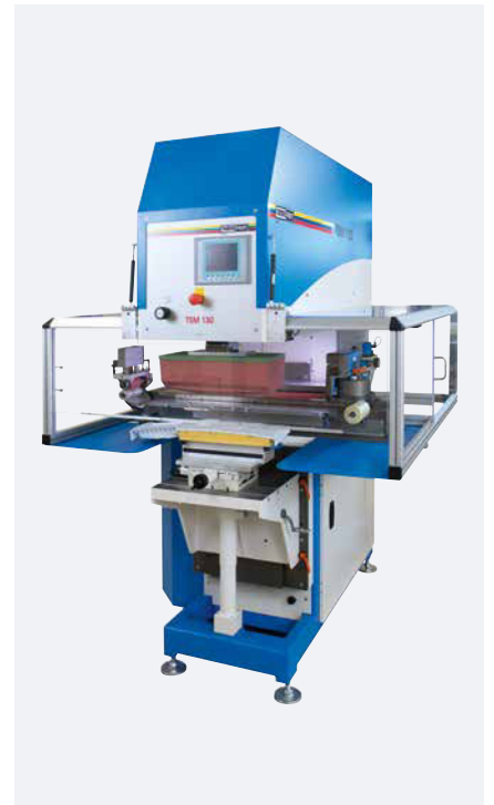
TSM 130 universal Querrakelkit