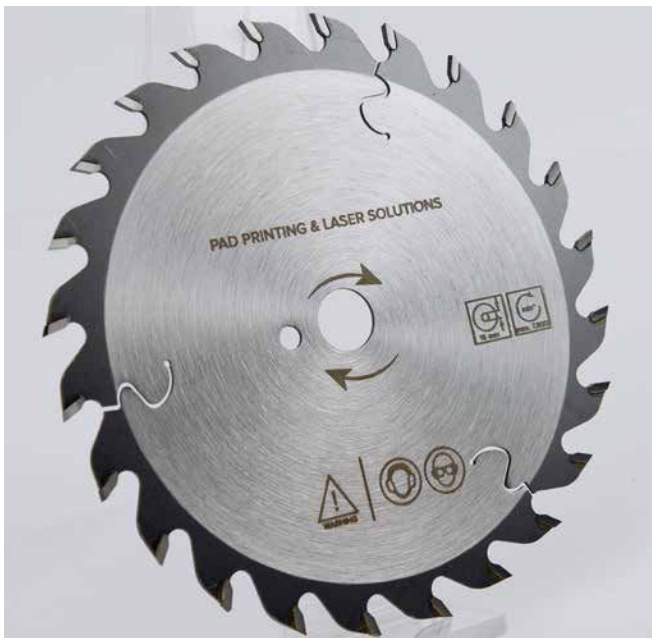
MONOLIGHT Compact Lasermarkierung von großflächige Objekte (Sägeblatt)