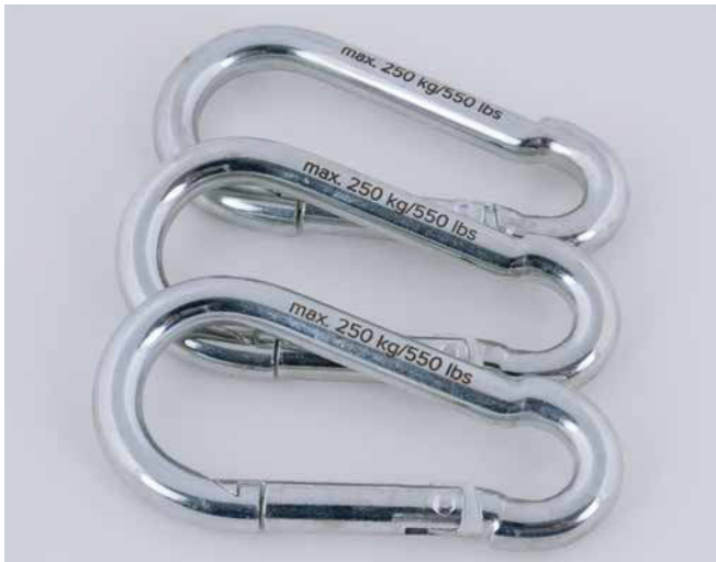
MONOLIGHT Compact Lasermarkierung auf Karabiner aus Aluminium