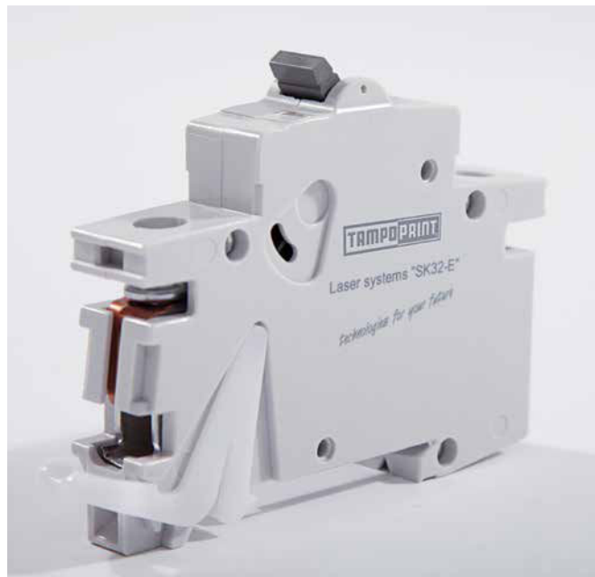
MONOLIGHT Compact Lasermarkierung von diversen Kunststoffmaterialien