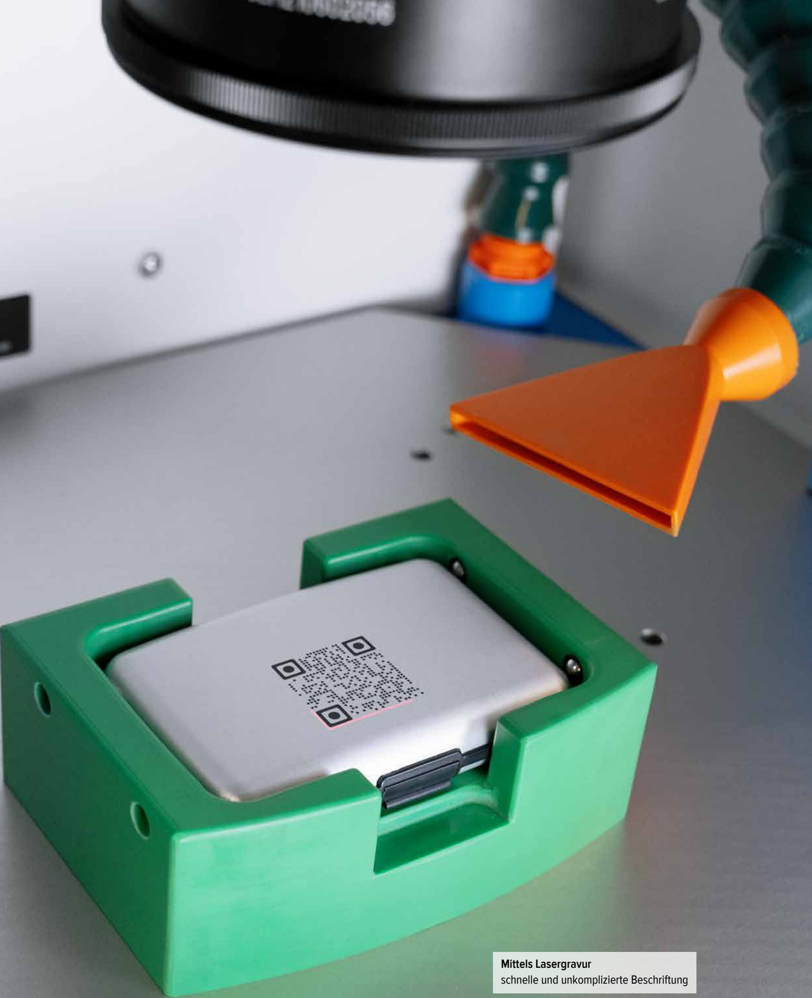
Mittels Lasergravur schnelle und unkomplizierte Beschriftung